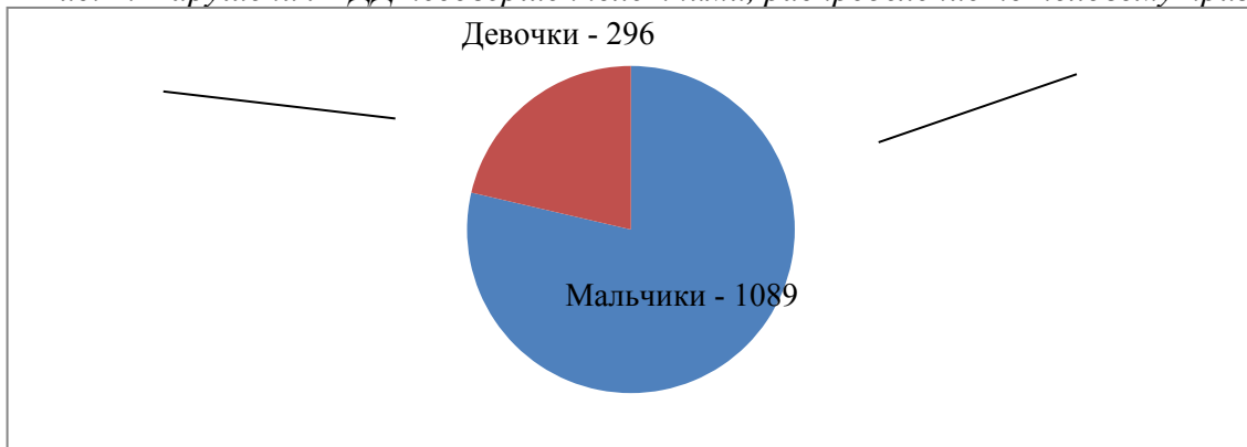
Рис. 1. Нарушения ПДД несовершеннолетними, распределение по половому признаку.

Из диаграммы видно, что мальчики до 16 лет чаще нарушают ПДД. В январе-июне 2024 года в процентном соотношении мальчики – 78,6%, девочки – 21,4% (рис. 1).