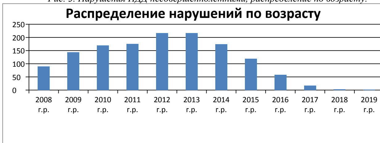
Рис. 3. Нарушения ПДД несовершеннолетними, распределение по возрасту.

Сделав выборку по образовательным учреждениям, было выявлено, что учащиеся следующих красноярских учебных заведений, а именно: